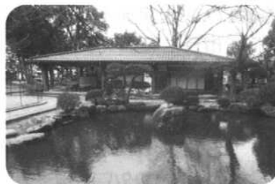
梅鯉庵(鳥取市上町 85)

※なお、現在はコロナウイルス感染症防止のため、一人以上の人と人との間隔をとる、手洗いや消毒の励行、マスクの着用などの対策をお願いします。