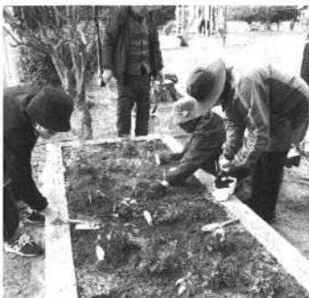
秋里一号公園 ナチュラルガーデン 植え付け作業中