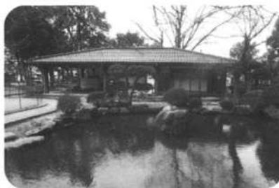
梅鯉庵(鳥取市上町85)

※なお、現在はコロナウイルス感染症防止のため、一以上の人と人との間隔をとる、手洗いや消毒の励行、マスクの着用などの対策をお願いします。