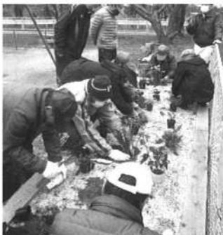
美萩野深沢公園 ナチュラルガーデン 植え付け作業中