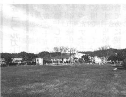
若葉台南第二公園

現在、芝生の管理を一手に引き 受けていただいているのは、この公 園をホームグラウンドに、月一、二 回グラウンドゴルフの例会を行っ ている「けやきクラブ(老人クラブ… 会員数二十九名)」の皆さんです。 乗用型芝刈り機を使っている芝刈り のほか、施肥や除草、植込剪定、落葉 清掃などを会員総出で、丁寧にやっ ていただいています。今回、優秀公 園という栄えある賞を頂くことが できたのは、同クラブの活動に因り して厚くお礼申し上げます。