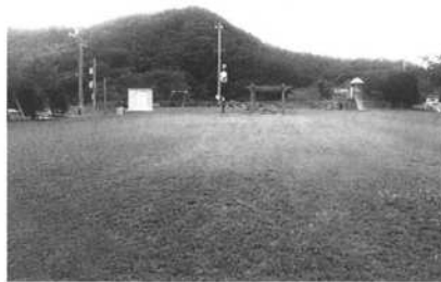
芝の植え付け状況 約3ヶ月後