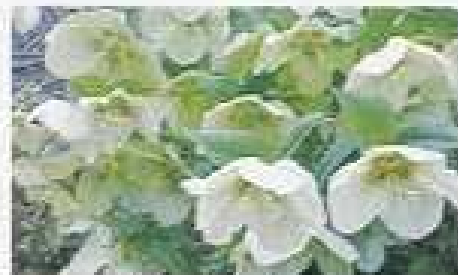
クリスマスローズ